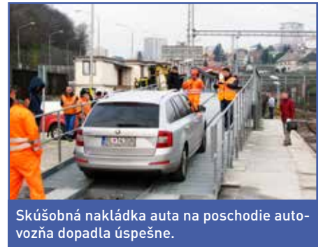
Skúšobná nakládka auta na poschodie autovožňa dopadla úspešne.

vej čelnej nakladacej autorampy pre osobné automobily ako náhrada za už existujúcu jednopodlažnú čelnú nakladaciu rampu. Projektová dokumentácia bola vyhotovená dodávateľským spôsobom firmou Prospol s. r. o. Samotnú realizáciu a výrobu ocelo-