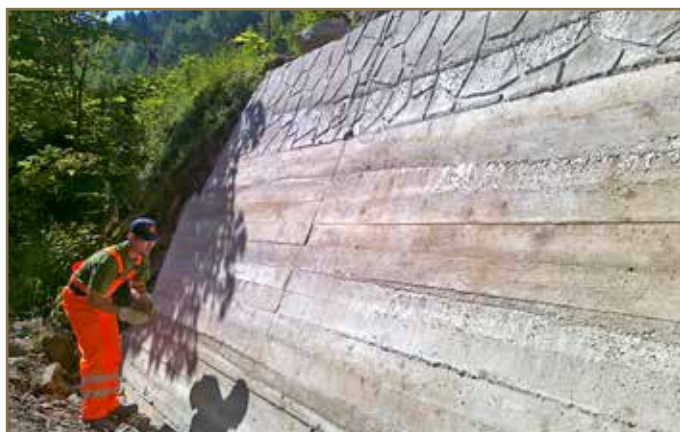
V Podbrezovej pri spevnenom svahu múrom.