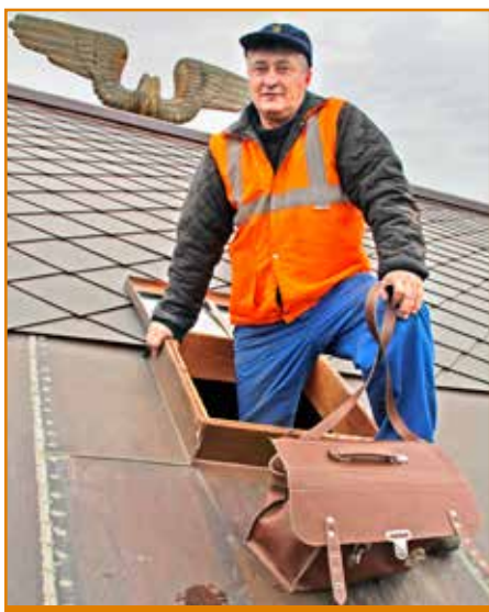
Malé strešné okienko priamo pod známym okrídleným kolesom bratislavskej stanice je vstupom na povalu vstupnej haly.