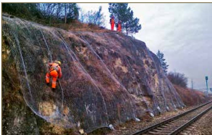
Aj toto je práca tunelárov.