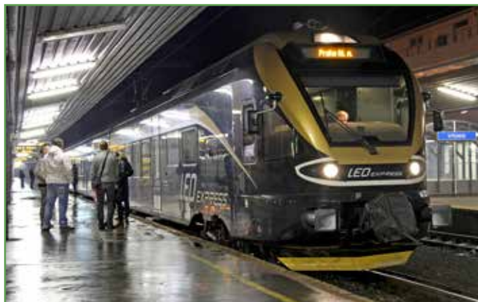
Nočný LEO Express, ktorý si vozi aj bezpečnostnú službu, má pravidelný príchod do Košíc o 22:27 hod. Počas 47 minútového pobytu interiér vyčistia a hneď sa vracia naspäť do Prahy. Cestujúcich púšťajú do vlaku 15 minút pred jeho odchodom.