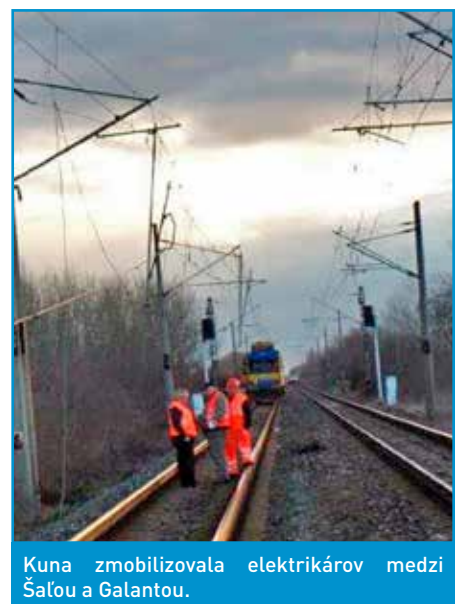
Kuna zmobilizovala elektrikárov medzi Šalou a Galantou.