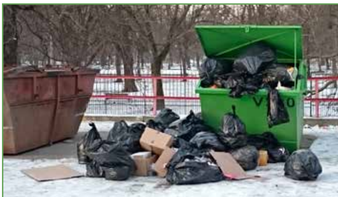
Preplnený kontajner na pôde ŽST Košice, určený na uskladnenie odpadu z končiacich vlakov Regiojet. Vedenie stanice takúto neestetickú a nehygienickú situáciu riešilo niekoľkokrát.