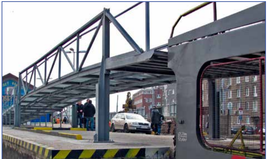
Novopostavená autorampa na Hlavnej stanici v Bratislave.

Od roku 2013 fungovala okrem Košíc, Humenného a Popradu autorampa aj v Bratislave. Na hlavnej stanici mala za úlohu zabezpečiť nakladanie cestných motorových vozidiel na spodnú plošinu autovožňa. Nakladanie však bolo obmedzené výškou vozidla, tá nemohla presiahnuť 1550 milimetrov. Z toho dôvodu sa začala riešiť požiadavka prevádzkovateľa na dobudovanie autorampy, ktorá umožní nakladanie osobných áut aj na hornú plošinu autovožňa. Projektová dokumentácia bola vypracovaná a v októbri 2014 sa začalo s realizáciou stavby, ktorá pozostávala z viacerých stavebných objektov. Po prvé išlo o vyhotovenie ocelevej konštrukcie autorampy a následne jej osadenie na základovú časť, čo zabezpečovali zamestnanci MO Bratislava. Bunku pre obslu-