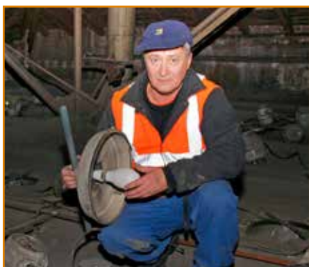
Do svietidla ide 125 W výbojka. Ak si tento výkon vynásobíme 36 lampami v hale, je to dosť veľká spotreba energie najmä v čase, keď už existujú moderné a úsporné svetelné zdroje.