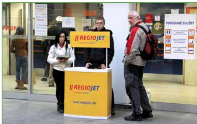
Absenciu pokladne v rekonštruovanej košickej stanici vyriešil RegioJet svojisky. Pred odchodom svojho vlaku si postaví prenosný pult priamo pred zákaznícke centrum ZSSK, lenže bez uzavretia nájomnej zmluvy so ŽSR.