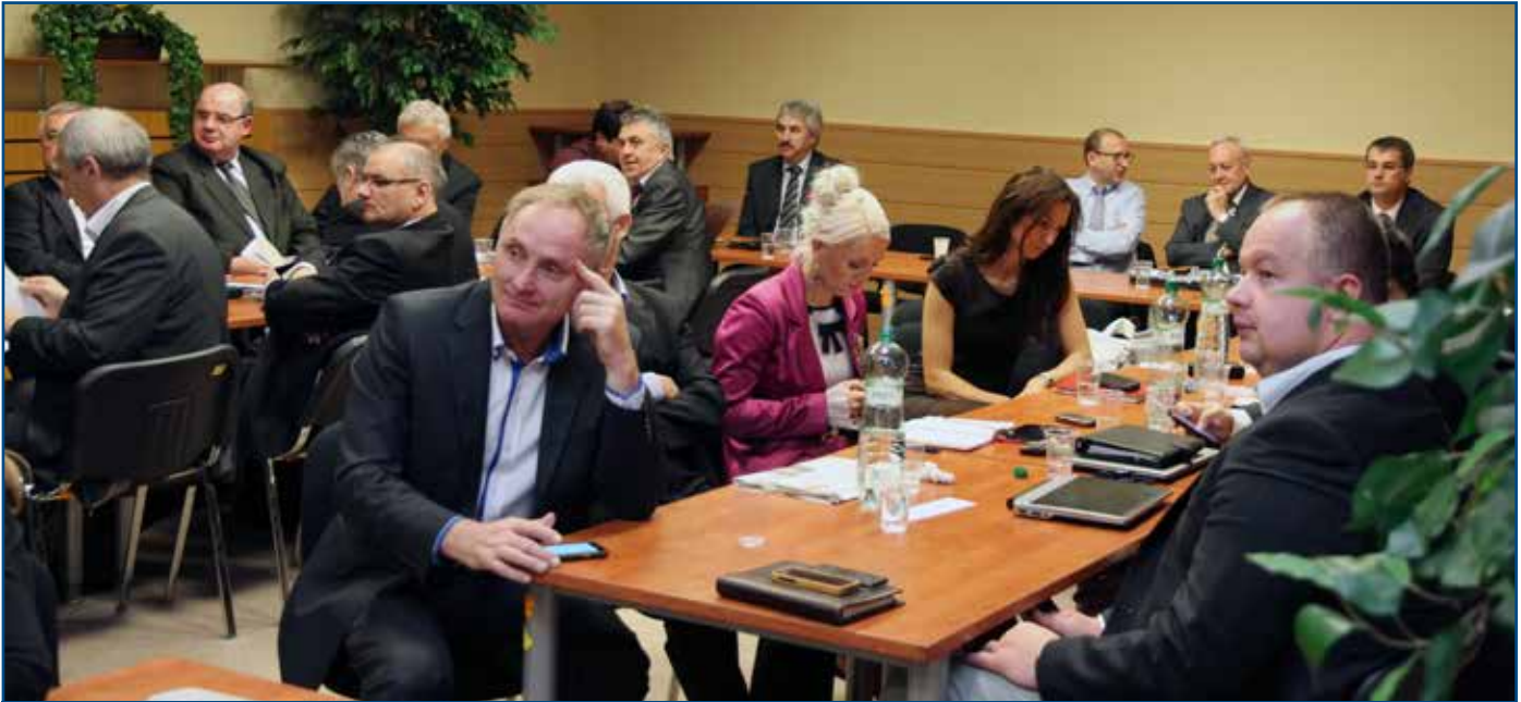
Osobitná pozornosť bola na novembrovej rozšírenej porade vedenia v rámci diskusie zameraná na uplatňovanie štandardov ŽST a prípadným sankciám.