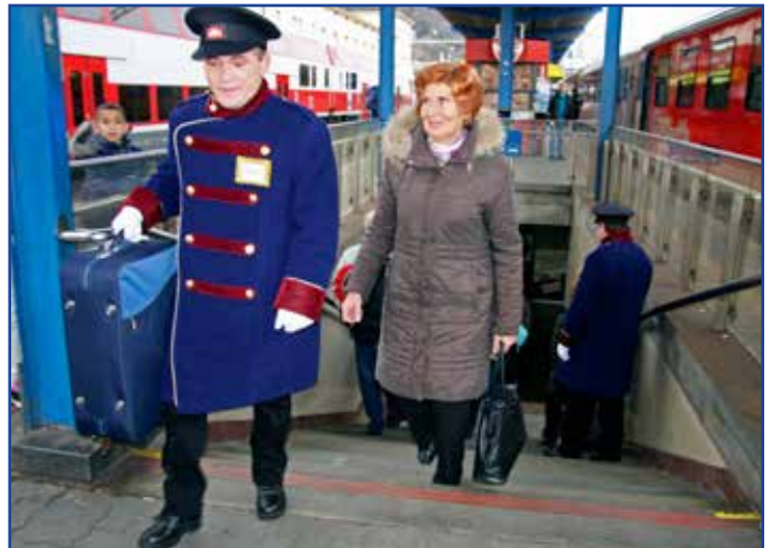
Ľudia bez domova pomáhajú, aj keď sami pomoc potrebujú. A to je hlavná myšlienka projektu združenia Proti prúdu, ktorý realizoval žiadosť neznamenej cestujúcej.