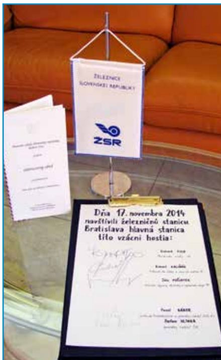
Vládny salónik bratislavskej hlavnej stanice si do svojej kroniky zapíše návštevu ďalšieho premiéra.

Väčšina zo študentov, ktorí obedovali s premiérom v jedálenskom vozni, pravidelne cestujú do školy vlakom, takže nové opatrenie a možnosť jazdiť bezplatne privítali.