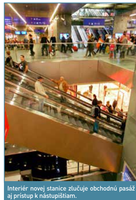
Interiér novej stanice zlučuje obchodnú pasáž aj prístup k nástupištiam.

akt, pretože na skôr sprevádzkovanú časť nástupíšť prichádzajú regionálne vlaky už od decembra 2012. Diaľkové spoje zavítali do viedenskej hlavnej stanice až s novým cestovným poriadkom. Projektanti pôvodne vyčíslili investičné náklady na 886 miliónov €. Počas výstavby sa táto suma zvýšila až na miliardu €, čo zaradilo stavbu na vrchol najväčších infraštruktúrnych projektov Rakúska všetkých čias. Na mapách alebo v navigácii novú stanicu ešte nenájdete. Stále v nich figuruje Südbahnhof, kam predtým jazdili aj vlaky z Bratislavy a ktorú pohltila nová stanica. Na modernú dominantu Viedne sa dá pozrieť aj pekne z nadhľadu, z 66,72-metrovej vyhlídkovej veže nachádzajúcej sa v susedstve. Po vyšliapaní alebo vyvezení sa výťahom je z jej vrcholu nádherný výhľad na stanicu a za pekného počasia dovidíte až do historického centra. V okolí stále pokračujú stavebné práce, ktoré neskončia ani v roku 2015. Spolu s dopravným uzlom tam vzniká celá nová štvrť veľká ako niektoré viedenské okresy. V budúcom roku by sa už stanica mala dočkať plnej prevádzky, kedy sem presmerujú aj regio-