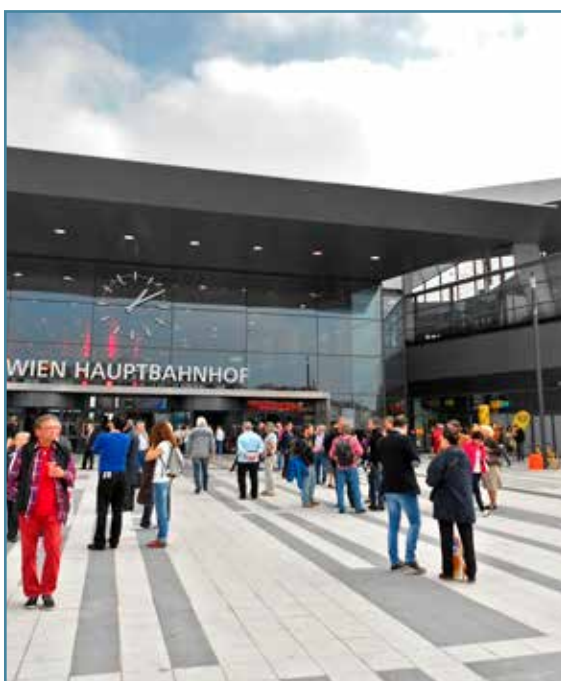
Pohľad na vstupnú halu Wien Hauptbahnhof.