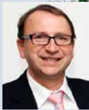
Vážené kolegyně a kolegovia,

azda len na tom, ako rýchlo vyrastajú naše deti a blížia sa opäť Vianoce si uvedomujeme, ako plynie čas. Tichučko, s každodennou rutinou, sa v pravidelnom kolobehu mihajú dni, týždne, mesiace a roky. Vo všedné dni sme v zajatí svojich povinností, úloh, termínov a cieľov. Našťastie však každoročne máme aj čas Vianoc. Ten najkrajší čas, kedy zmákneme aj prísny pohľad či vážna tvár, kedy sa znenazdajky usmeje aj neznámy na ulici či za volantom, keď si na vianočných trhoch s punčom pripíjame aj s milým neznámym pri vedľajšom stole. S prvými svetielkami v oknách, domoch či na stromčekoch sa koná aj malá každoročná zmena v našej duši a našom srdci. Opäť v ňom nájdeme miesto aj tí, ktorí ho celý rok skúšali rôznymi atakmi, vysvetlia sa nedorozumenia, prichádza čas, keď konečne zladíme termín na stretnutie s priateľmi.