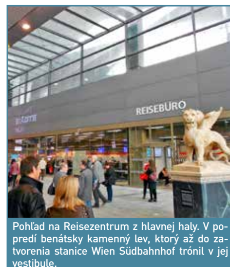
Pohľad na Reisezentrum z hlavnej haly. V popredí benátsky kamenný lev, ktorý až do zotvorenia stanice Wien Südbahnhof trónil v jej vestibule.