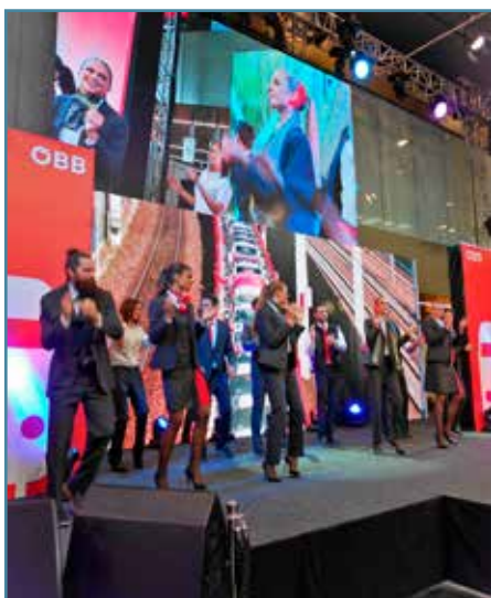
Počas ceremoniálu sa uskutočnila aj módna prehliadka nových návrhov uniforiem ÖBB.