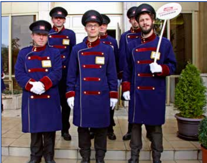
Nosiči majú špeciálne uniformy ušité na mieru a biele rukavičky.