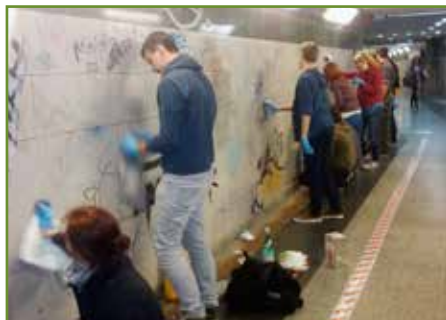
Dobrovoľníci čistili steny podchodu takmer 3,5 hodiny.

Mladí ľudia študujúci prevažne na STU v Bratislave sa ponúkli, že dobrovoľne a bez nároku na plácu vyčistia podchod jednej frekventovanej bratislavskej stanice. „Bývame v rôznych častiach Slovenska a pravidelne cestujeme vlakom. Zakaždým, keď prechádzame cez železničnú stanicu