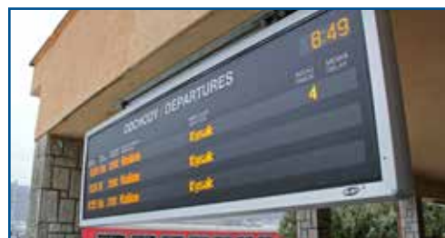
Svetelné panely poskytujú informácie o odchodoch a meškani vlakov, ale tiež o mimoriadnych udalostiach vo vlakovej doprave.