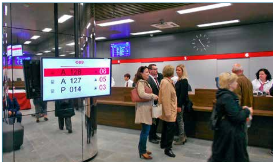
Zákaznícke centrum ÖBB používa lístočkový vyvolávací systém známy prevažne z bánk. Súčasťou je i detský kútik s minikinom.