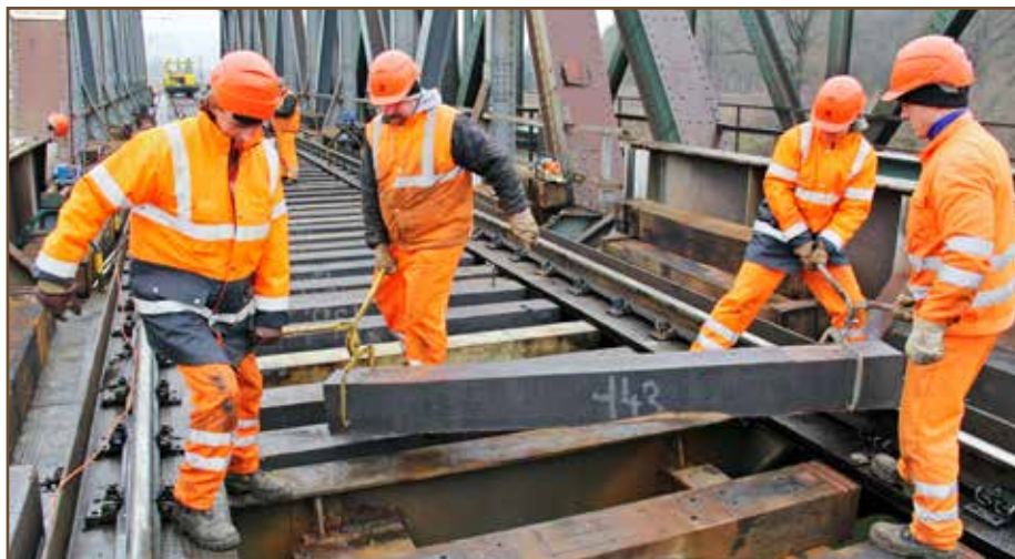
Manipulácia s ťažkou mostnicou si v nečase vyžaduje zvýšenú opatrnosť.

mili svoju pozornosť na most v 2. traťovej kolaji pri Kostoľanoch nad Hornádcom. Jeho stav už bol alarmujúci, pretože mnohé mostnice zožierala hniloba a traťová rýchlosť bola na ňom znížená až na 20 km/h. Oprava sa už v žiadnom prípade nemohla odsúvať, a tak zdatných chlapcov čakala neľahká úloha – vý-