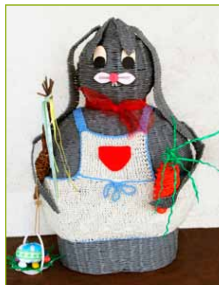
Papierový zajac pred dopravnou kanceláriou v Martine prináša radosť cestujúcej verejnosti.

zajacov. „Najzdĺhavejšia je príprava papierových ruličiek. Každý má svoju techniku rolovania pásov papiera. Zvyčajne