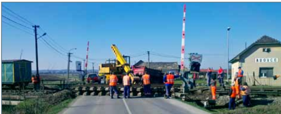
Priecestie v Abovciach dosť výrazne devastuje vysoká frekvencia kamiónov. Dúfajme, že to nové nepodľahne ich sile skôr ako to bude potrebné.

Priecestie začalo rekonštruovať SMSÚ ŽTS TO Jesenské druhý marcový týždeň. Dôvodom opravy bol nevyhovujúci stav koľajového roštu a prejazdovej konštrukcie koľaje. Rekonštrukcia, ktorú podstúpilo priecestie, spočívala v obnove koľajového lôžka a koľajového roštu koľaje v dĺžke 24 m. Vymenili sa koľajnice v mieste priecestia v dĺžke 31 m po oboch stranách a zriadili tam novú prejazdovú konštrukciu z celogumových panelov „STRAIL-S“, v šírke 9,60 m. Sú tu aj nové asfaltové nábehy prejazdovej konštrukcie do vzdialenosti 4 m od osi koľaje po oboch jej stranách a pristúpilo sa aj po