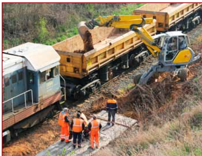
Z nestabilnej päty svahu sa odťažilo množstvo kubíkov zeminu.