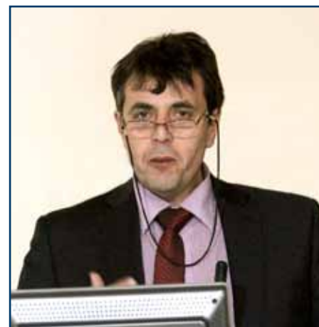
Evžen Nečas hovoril o problémoch zo získavaním zdravotnej spôsobilosti na Slovensku.