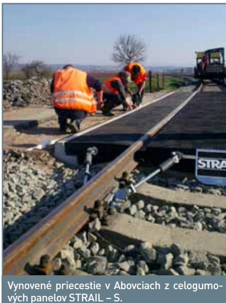
Vynovené priecestie v Abovciach z celogumových panelov STRAIL – S.

oprave geometrickej polohy koľaje v dĺžke 400 m. Práce boli realizované počas troch dní s výlukou železničnej dopravy. Prvý a druhý deň boli odrieknuté 4 vlaky a tretí deň boli odrieknuté 2 vlaky. Náklady na rekonštrukciu železničného priecestia boli 82 797,- €. Okrem SMSÚ ŽTS TO Jesenské sa na rekonštrukcii priecestia v Abovciach zúčastnili aj SMSÚ ŽTS MDS Zvolen a SMSÚ OZT ZT Lučenec. Externým dodávateľom boli Dopravné a inžinierske stavby, a. s., Bratislava.