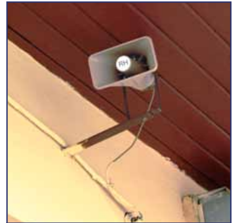
...a aj 4 nové reproduktory.