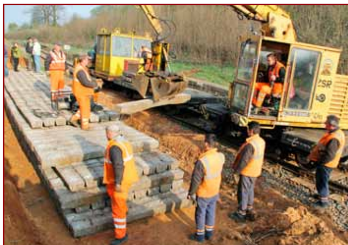
Zaťažovaciu lavicu tvoria betónové podvaly, vyzískané z modernizácie koridoru.