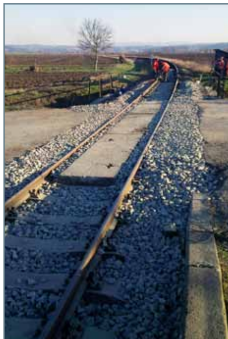
Ešte staré priecestie...

Železničné priecestie v Abovciach v km 2,694 v okrese Rimavská Sobota prešlo v ostatných dňoch rekonštrukciou. Podstatne ho ničia predovšetkým kamióny smerujúce do Maďarska, ktorých vodiči sa chcú vyhnúť mýtu.