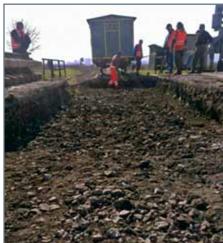
Po trati ani spomienky. Za tri dni dokázali naši zamestnanci na priecestí v Abovciach vybudovať nové priecestie.