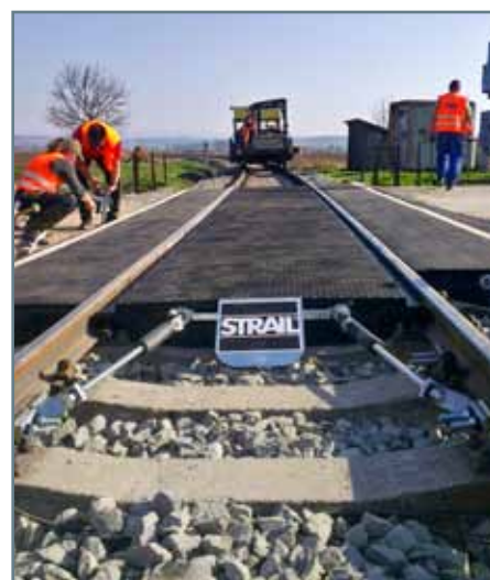
Oprava priecestia bola nutná, stav koľajového roštu a prejazdovej konštrukcie koľaje bol nevyhovujúci.

Priecestie začalo rekonštruovať SMSÚ ŽTS TO Jesenské druhý marcový týždeň. Dôvodom opravy bol nevyhovujúci stav koľajového roštu a prejazdovej konštrukcie koľaje. Rekonštrukcia, ktorú podstúpilo priecestie, spočívala v obnove koľajového lôžka a koľajového roštu koľaje v dĺžke 24 m. Vymenili sa koľajnice v mieste priecestia v dĺžke 31 m po oboch stranách a zriadili tam novú prejazdovú konštrukciu z celogumových panelov „STRAIL-S“, v šírke 9,60 m. Sú tu aj nové asfaltové nábehy prejazdovej konštrukcie do vzdialenosti 4 m od osi koľaje po oboch jej stranách a pristúpilo sa aj po