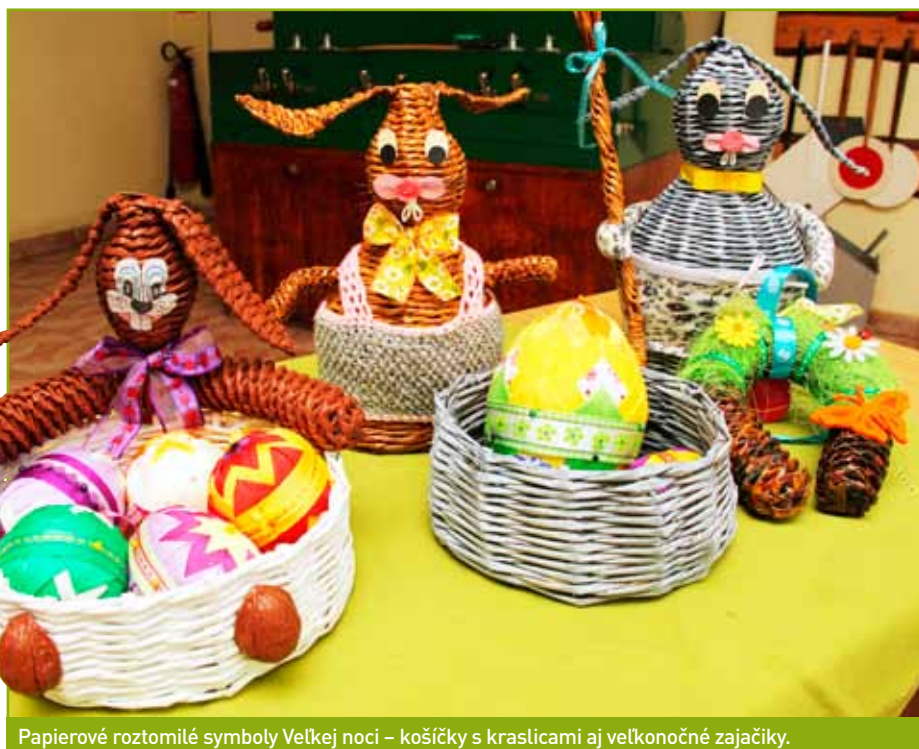
Papierové roztomilé symboly Veľkej noci – košíčky s kraslicami aj veľkonočné zajačky.