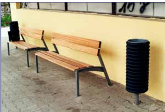
Cestujúcim pribudlo nielen nové nástupišťe, ale aj 8 lavičiek a 10 odpadkových košov...

fabrikátov PREMAC. Povrch nástupišťa je spevnený zámkovou dlažbou so zapracovanými špeciálnymi prvkami pre nevidiacich. Pre zachytenie dažďových vôd pri koľaji č. 1 bol zrealizovaný odvodňovací 50-metrový žľab so záustenním do jestvujúcej priekopy. Pri koľaji č. 2 je odvodnenie priestranstva riešené vyspádovaním od budovy. Stredový plot medzi koľajami je očistený a natretý ochranným dvojvrstvom náterom. V rámci stav-