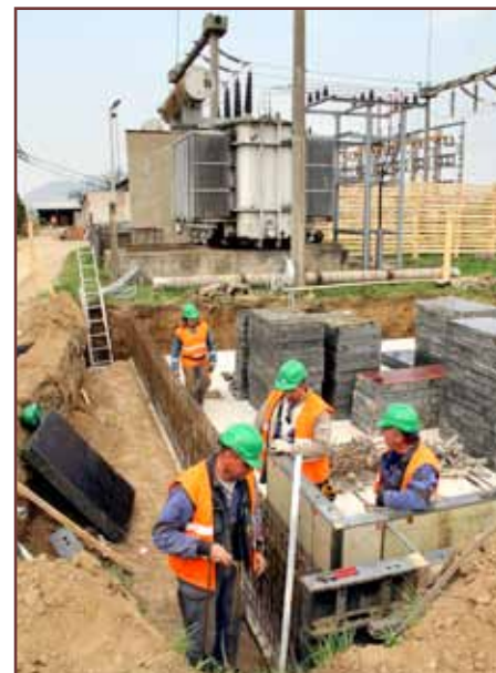
Dodávateľ buduje nové zastrešené stanovište pre transformátor rozvodne 110 kV. Ten súčasne, v pozadí, je vystavený účinkom počasia.

pečené napájanie trate. Vzdialenosť k susednej napájacej stanici v Dobrej je totiž príliš veľká, takže dlhodobšie vypnutie meniarne v Borši by viedlo k zhoršeniu napätových pomerov na elektrifikovanej trati a obmedzeniu vlakovej dopravy medzi Michalánmi a Čiernou nad Tisou. Ibaže meniareň v Borši nemá železničnú vlečku, takže pristavenie prevozného trakčnej meniarne je nereálne. Ako teda zabezpečiť napájanie trate počas výmeny technológie v trakčnej meniarňi? „Prevzali sme riešenie naprojektované pre koridorové trate. Stabilnú meniareň v Borši počas rekonštrukcie zastúpi kontajnerová trakčná meniareň. Kontajnery s usmerňovačmi, transformátormi, spínačmi sa len osadia na spevnené základy