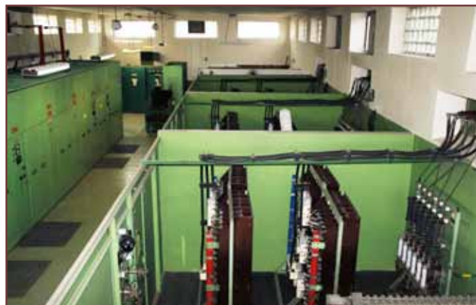
Súčasnú technológiu meniarne nahradí moderná - menšia a výkonnejšia.