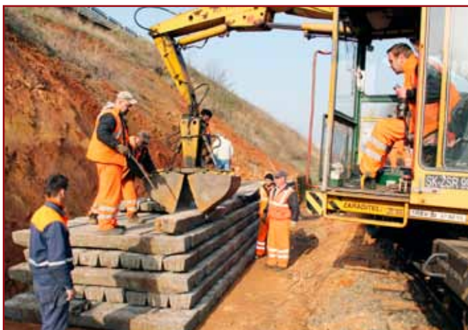
Zamestnanci z plešiveckého pracoviska SMSÚ ŽTS TO Košice ukládali podvaly k päte svahu, ktoré svojou hmotnosťou zabránia pohybu zeminu.