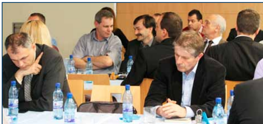
Stretnutia sa zúčastnili zástupcovia takmer všetkých dopravcov na Slovensku.