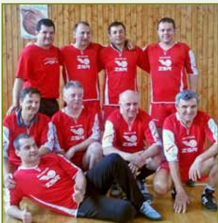
Prvý aprílový deň si zmerali svoje sily vo futbale tri družstvá, troch železničných spoločností. Spoznávajú v dresoch našich?

Aj členovia manažmentu sa mali možnosť predviesť so svojimi futbalovými schopnosťami na II. ročníku futbalového turnaja troch generálnych riaditeľov železničných firiem. V prvý aprílový piatok sa hráči s podmienkou, že majú nad 40 rokov a vyše 20 rokov pracujú na železnici, vyzliekli z oficiálnych oblekov a nahodili slušivé futbalové dresy.