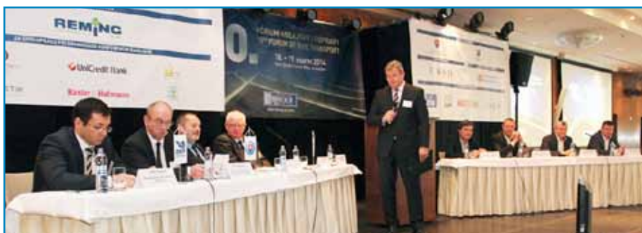
Počas druhého dňa konferencie bola prvýkrát zaradená do programu panelová diskusia.