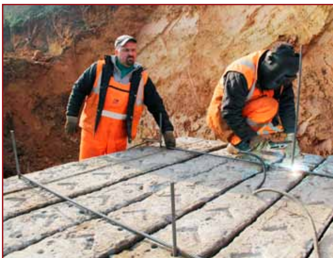
Naukladané podvaly vzájomne držia pozvárané kovové tyče.