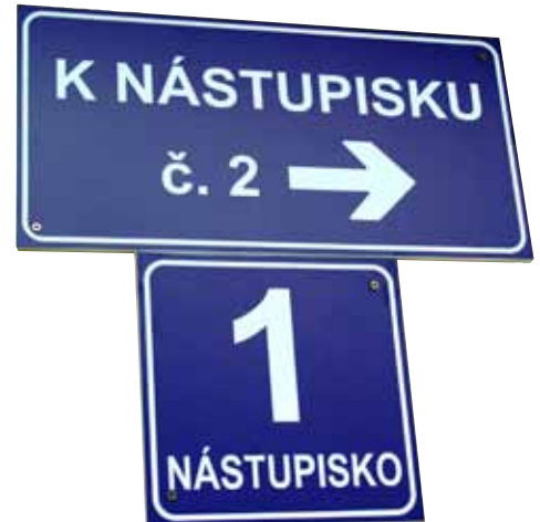
Aj informačné tabule sú nové.

by došlo k vybudovaniu nového vonkajšieho osvetlenia nástupišťa a koľají sklopnými stôžiarimi a taktiež došlo k výmene rozhlasovej ústredne a 4 reproduktorov. Aj podchod, ktorý býva pri dlhších dažďoch zaplavený čaká v najbližších rokoch rekonštrukcia. Tá sa bude týkať najmä odvodnenia.