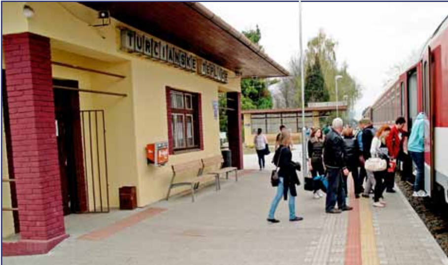
Z nového nástupišťa rovno do vlaku...

Železničná zastávka Turčianske Teplice, ležiaca na trati Vrútky – Banská Bystrica – Zvolen v medzistaničnom úseku Diviaky – Dolná Štubňa, prešla v minulom roku zmenami. Nové nástupišťia dali zastávke celkom iný šat.