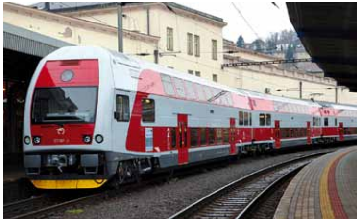
Nová elektrická poschodová jednotka série 671 sa predstavila 9. decembra na bratislavskej hlavnej stanici.

Jána Figeľa, 1. podpredsedu vlády a ministra dopravy, výstavby a regionálneho rozvoja, mali možnosť zažiť novinári v druhý decembrový štvrtok aj v úlohe rušňovodiča. Vyskúšal si ju na zhruba 50-kilometrovom úseku na trati Bratislava hlavná stanica – Devínska Nová Ves pri príležitosti slávnostného uvedenia úplne novučičky elektrickej poschodovej jednotky série 671 do života. Tá dostala meno Katarína, podľa patrónky železničiarov, svätej Kataríny Alexandrijskej.