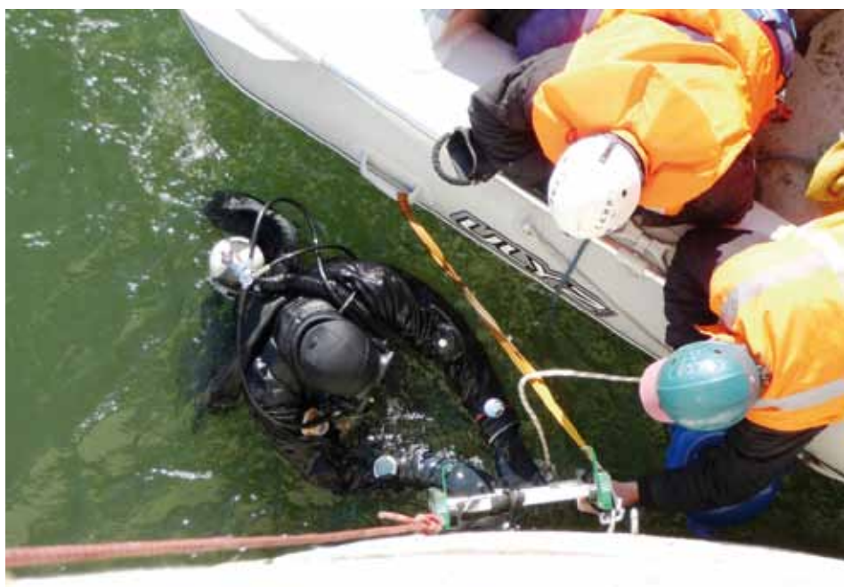
Spolupráca s ďalšími kolegami je nesmierne dôležitá pri každom potápaní.