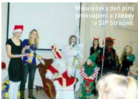
Mikulášsky deň plný prekvapení a zábavy v SIP Strečno.

Na tohtoročného Mikuláša v SIP Strečno sľubovali organizátori zaujímavý program a prekvapenie. A všetko splnili do bodky! Na prvú decembrovú sobotu sa tešili nielen deti, ktorých nakoniec bolo vyše sto, ale aj ich rodičia, z ktorých mnohí využili ponuku prežiť „víkendovku“ prostredníctvom sociálneho fondu v Strečne.