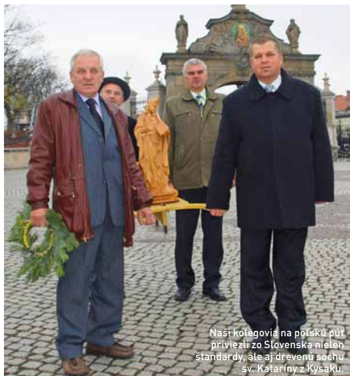
Naši kolegovia na poľskú púť priviezli zo Slovenska nielen štandardy, ale aj drevenú sochu sv. Kataríny z Kysaku.