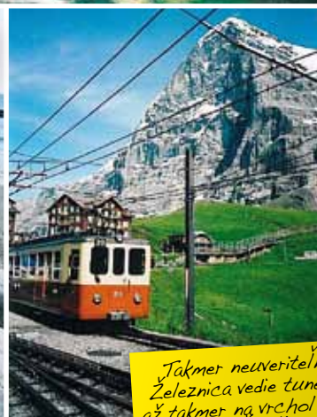
Takmer neuveriteľné. Železnica vedie tunelom až takmer na vrchol hory Eiger vo Švajčiarsku.