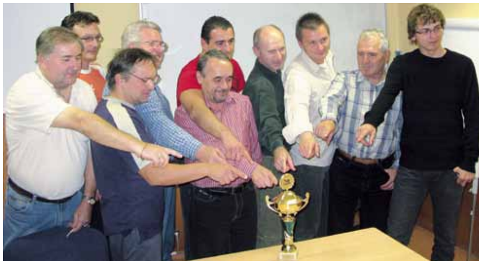
Ocenení slovenskí železniční filmári ukazujú na putovný pohár, ktorý dostáva Skokan roka za najlepší film a je snom všetkých zúčastnených.