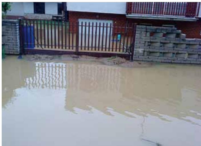
Dom zostal po vyliatí rybníka a pretrhnutí hrádze celkom zatopený.