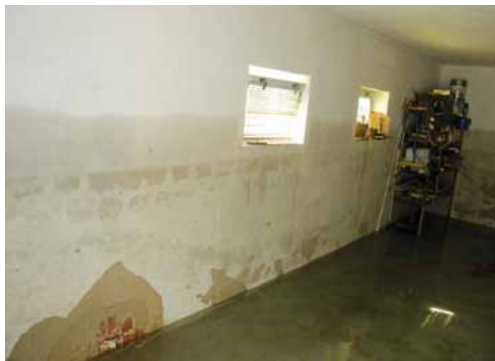
Na vlhkej stene vidno, pokiaľ voda siahala.