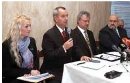
Tlačová beseda k novému GVD sa uskutočnila 9. decembra na bratislavskej hlavnej stanici, kde zástupcovia železničných spoločností informovali cestujúcich prostredníctvom médií, aké zmeny ich čakajú v novom cestovnom poriadku, ktorý platí do 10. decembra 2011.

Ďalšou zmenou je, že na trati Žilina - Horní Lideč - Praha sú vedené namiesto dnešných 3 párov Ex vlakov 4 páry Ex vlakov a na trati Bratislava - Štúrovo - Budapešť je tiež pridaný jeden vlak. Namiesto doterajších 4 párov pôjde 5 párov EC vlakov.