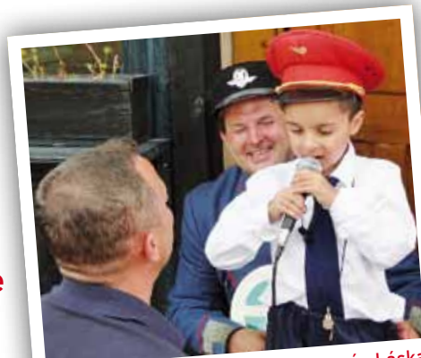
S Jožkom sa osud veľmi nemazná. Láska matky a dobrých priateľov mu však nechýba.

Mať sen, po niečom túžiť je prirodzená vlastnosť každého z nás. Exotická dovolenka, krásne auto, veľký dom... To je samozrejme len zlomok túžob, ktoré si pri plnom zdraví môžeme splniť, i keď sa to nemusí každému podariť. Ak však zdravie pokrívá, aj tie „najbežnejšie“ sny sa nám začnú rúcať ako domček z karát. Vtedy sa túžby, ale aj bežné veci prispôbujú často ťažkej životnej situácii. Sny sa strácajú a stále väčšie obrátky naberajú túžby po veciach, ktoré sú samozrejmosťou – ale iba pre zdravých.