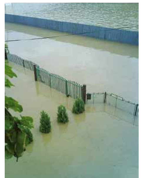
Pohľad na dvor rodiny Brutovských bol naozaj smutný.