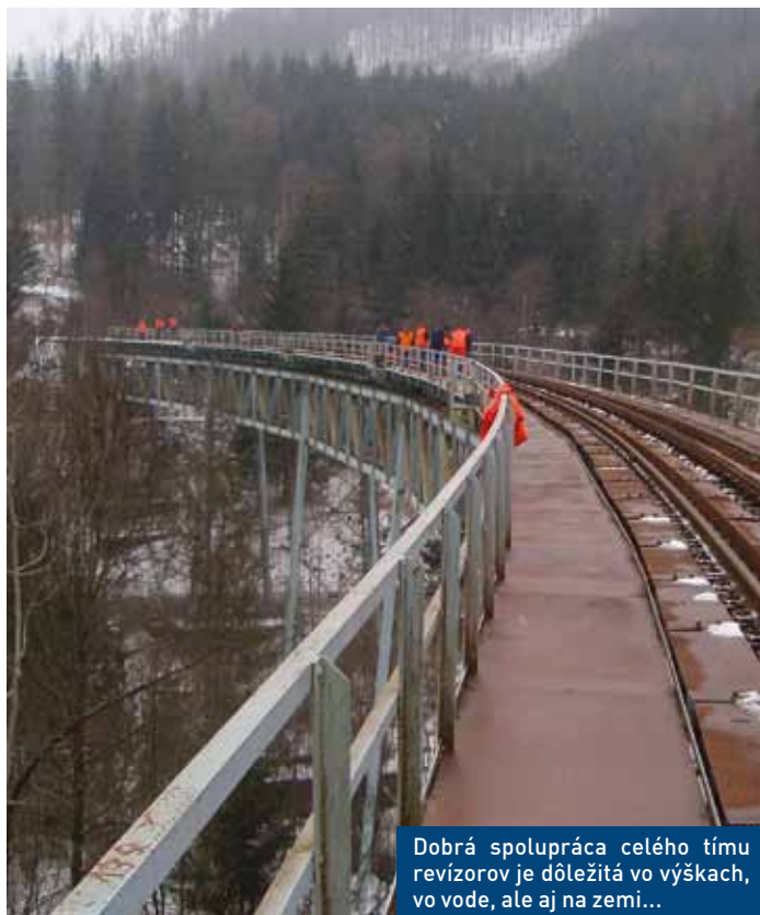
Dobrá spolupráca celého tímu revízorov je dôležitá vo výškach, vo vode, ale aj na zemi...

Kontrola oceľových a betónových konštrukcií, ktoré kontrolujú naši kolegovia aj lanovou technikou, je ďalšou činnosťou v náplni práce revízorov.