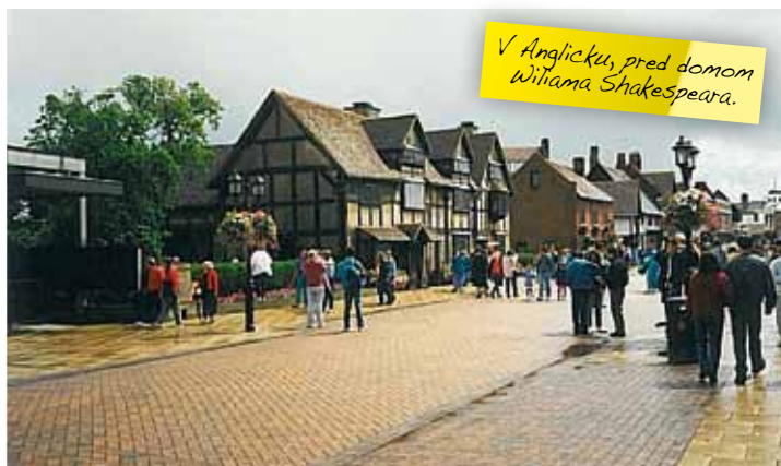
V Anglicku, pred domom Williama Shakespeara.