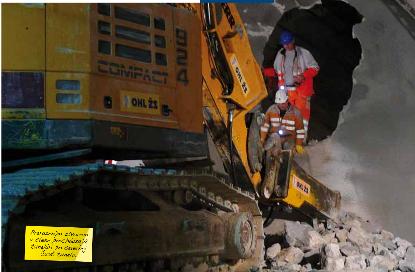
Prerazeným otvorom v stene prechádzajú tunelári zo severnej časti tunela.