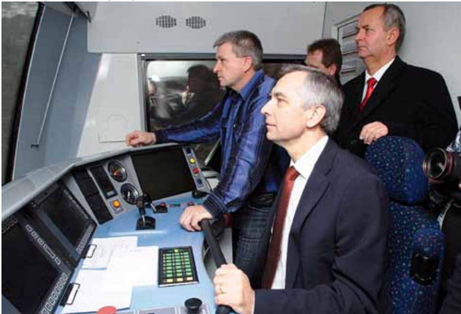
Ministromi sa v kabíne rušňovodiča mimoriadne páčilo, ako sám uviedol, bol to pre neho zážitok.

Cestujúcej verejnosti je k dispozícii na tratiach v okolí Žiliny od 12. decembra, odkedy platí nový grafikon vlakovej dopravy. Katarína bude jazdiť ako osobný vlak zo Žiliny do Trenčína, Liptovského Mikuláša a zo Žiliny do Čadce a späť. – Tento vlak je prvým v poradí, ale nie posledným , – uviedol v tejto súvislosti minister dopravy Ján Figeľ. Spolu by ich malo po slovenských železničiach jazdiť celkom desať. V poradí druhá EPJ 671 bude jazdiť od februára 2011. Do konca budúceho roku by malo dovedna jazdiť 5 nových EPJ, a to už aj na tratiach Žilina – Poprad – Tatry – Košice a Košice – Čierna nad Tisou. V roku 2012 budú nasadené ostatné štyri elektrické poschodové jednotky radu 671.