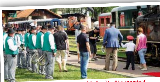
Na natáčanie v Čiernom Balogu budú ľudia ešte dlho spomínať.