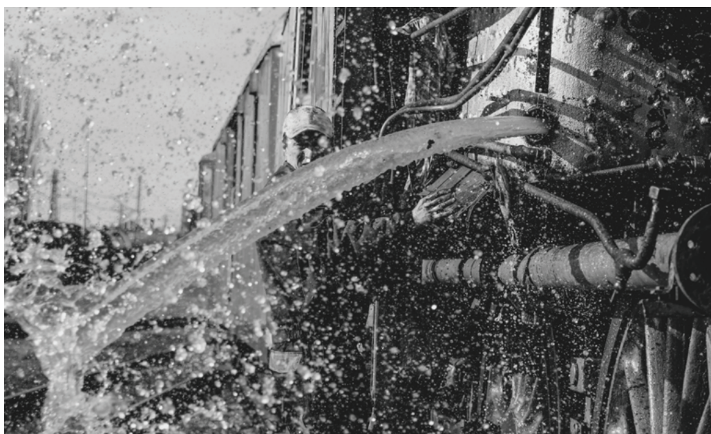
Vypúšťanie vody z kotla.