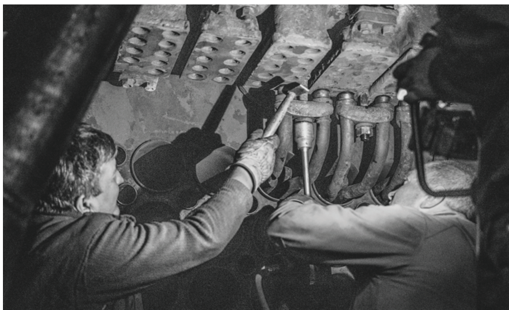
Vkladanie prehrievacích článkov.