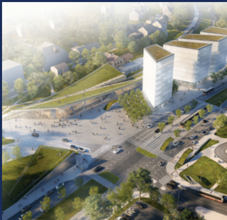
Vizualizácia celkového pohľadu na budúcu stanicu Praha-Veleslavín.

Dynamický tvar budovy a jej konštrukcia sú inšpirované rýchlosťou vlakovkej dopravy. Hlavným cieľom architektov bolo zaistiť logickú a jednoduchú previazanosť stanice s pešou, cyklistickou, verejnou hromadnou a automobilovou dopravou. Dôležitým prvkom návrhu sú ekologické aspekty s ohľadom na meniacu sa klímu mestského prostredia. Budova a jej okolie sú navrhnuté tak, aby prirodzene zadržovali vodu a vytvárali prostredie pre rozmanité ekosystémy.