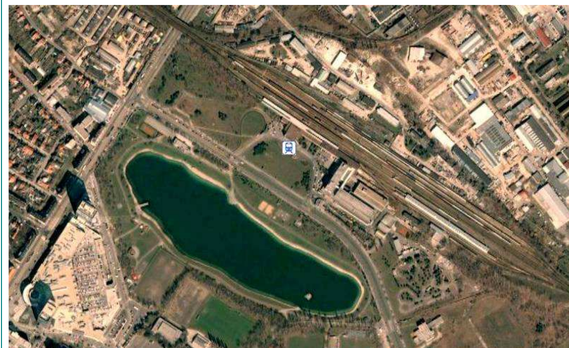
Poloha ŽST Bratislava Nové Mesto

Cez systém železničných prepojení v rámci Bratislavy je ŽST Bratislava Nové Mesto napojená na hlavné európske železničné koridory. Bratislava je súčasťou dvoch európskych železničných koridorov. IV. koridor spája Nemecko s Rumunskom po trati Drážďany – Praha – Bratislava – Viedeň – Budapešť – Arad, pričom jeho trasa na území Slovenska dosahuje dĺžku približne 80 km. V. trans - európsky koridor vytvára spojenie medzi Talianskom a Ukrajinou po trati Benátky – Koper – Terst – Ľubľana – Budapešť – Užhorod a doplnkovej trati V. a Bratislava – Žilina – Užhorod. Úsek V. koridoru, ktorý prechádza územím SR je dlhý 548 km. Nasledujúci obrázok znázorňuje pozíciu ŽST Bratislava Nové Mesto v rámci železničnej siete Slovenska.