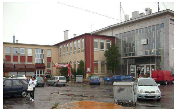
Budova ŽST – ľavé krídlo