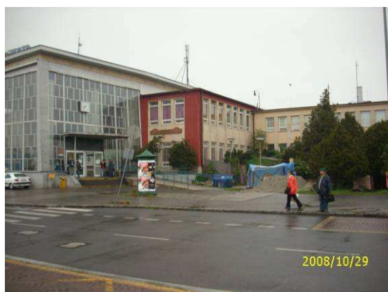
Pravé krídlo budovy ŽST