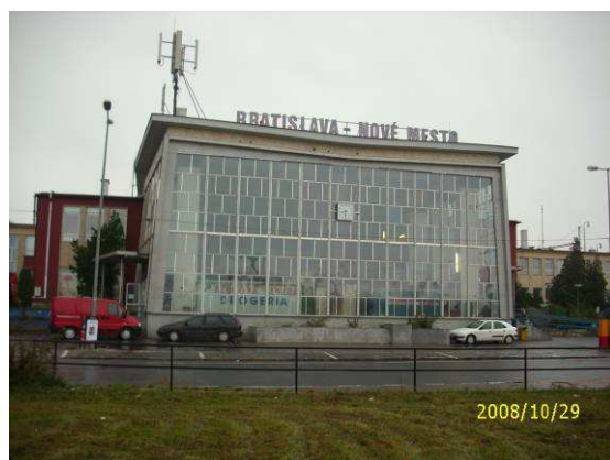
Budova ŽST – čelný pohľad